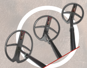
FMF® trådløse søkehoder 22 cm, 28 cm og 34 cm