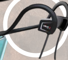
BH-01 Benledende hodetelefon