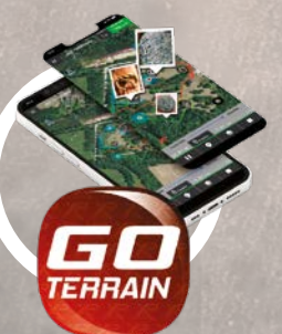
App for Android og iPhone Kartlegg dine turer og funn!