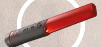
MI-6 finsøker med trådløs forbindelse