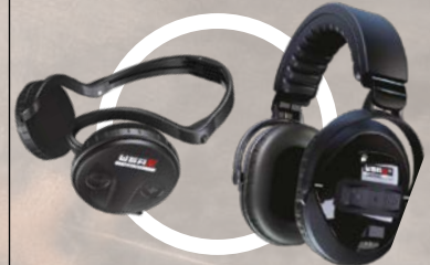
WSA II og WSA II XL trådløse hodetelefoner