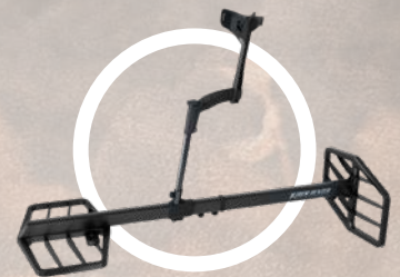
XTREM Hunter søkehode for dypsøk ned til 5 meter