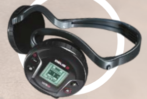
WS6 trådløs hodetelefon