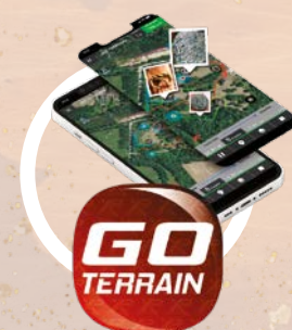
App for Android/iPhone Kartlegg dine turer og funn!