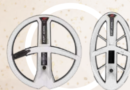
HF SØKEHODER 22 cm HF søkehode: 15, 28, og 54 kHz + shift Elliptisk HF søkehode: 15, 28 og 80 kHz + shift