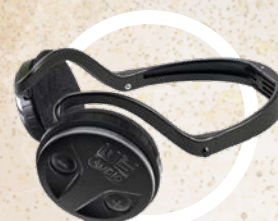
WS AUDIO trådløs hodetelefon