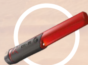
MI-6 FINSØKER med trådløs forbindelse