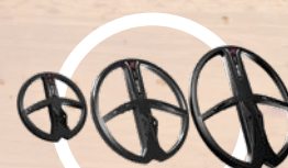
X35 SØKEHODER 22 cm, 28 cm og 34 cm 4, 8, 12, 18 og 25 kHz + shift